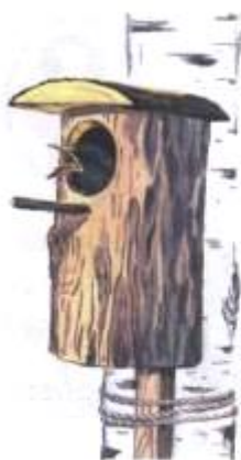
Скворец на скворечнике. (В)

7. Упражнение «Исправь ошибки»: Рассмотрите картинки. Послушайте предложения и исправьте ошибки.